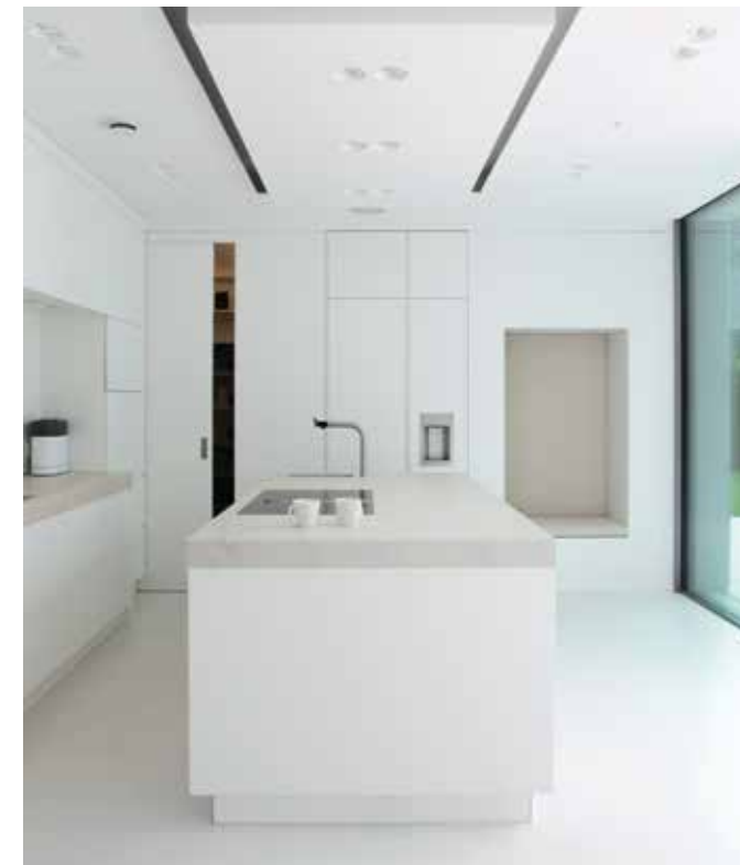
Köket sett från den svängda trappan där valet av färg, läge och design gör att det begränsade utrymmet ändå känns riktigt rymligt. I en inbuktning i väggen har man placerat en bänk där man kan slappna av och njuta av utsikten mot trädgården.

E tt ungt par fick möjlighet att sätta bo i området och bad arkitektkontoret Stuart Stadler att planera och realisera sitt bostadsprojekt.