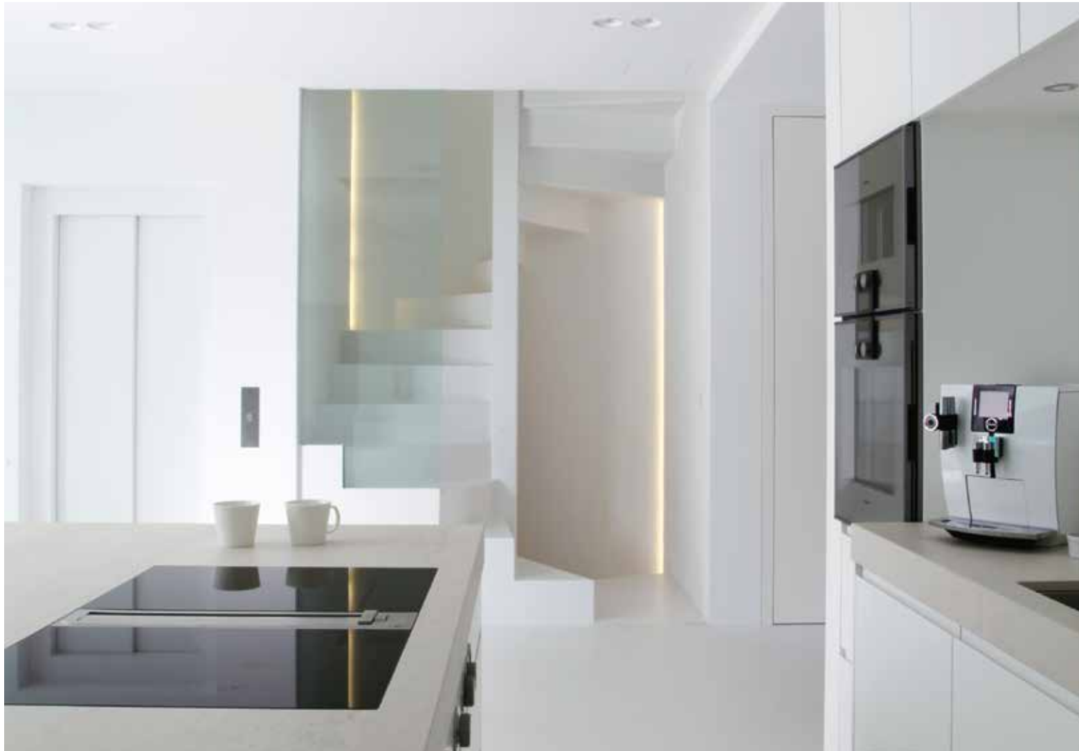
Köket har en öppen planlösning med högteknologisk utrustning. I mitten står ett bord av travetinsten mitt emot en slingrande trappa som leder upp till övervåningen.