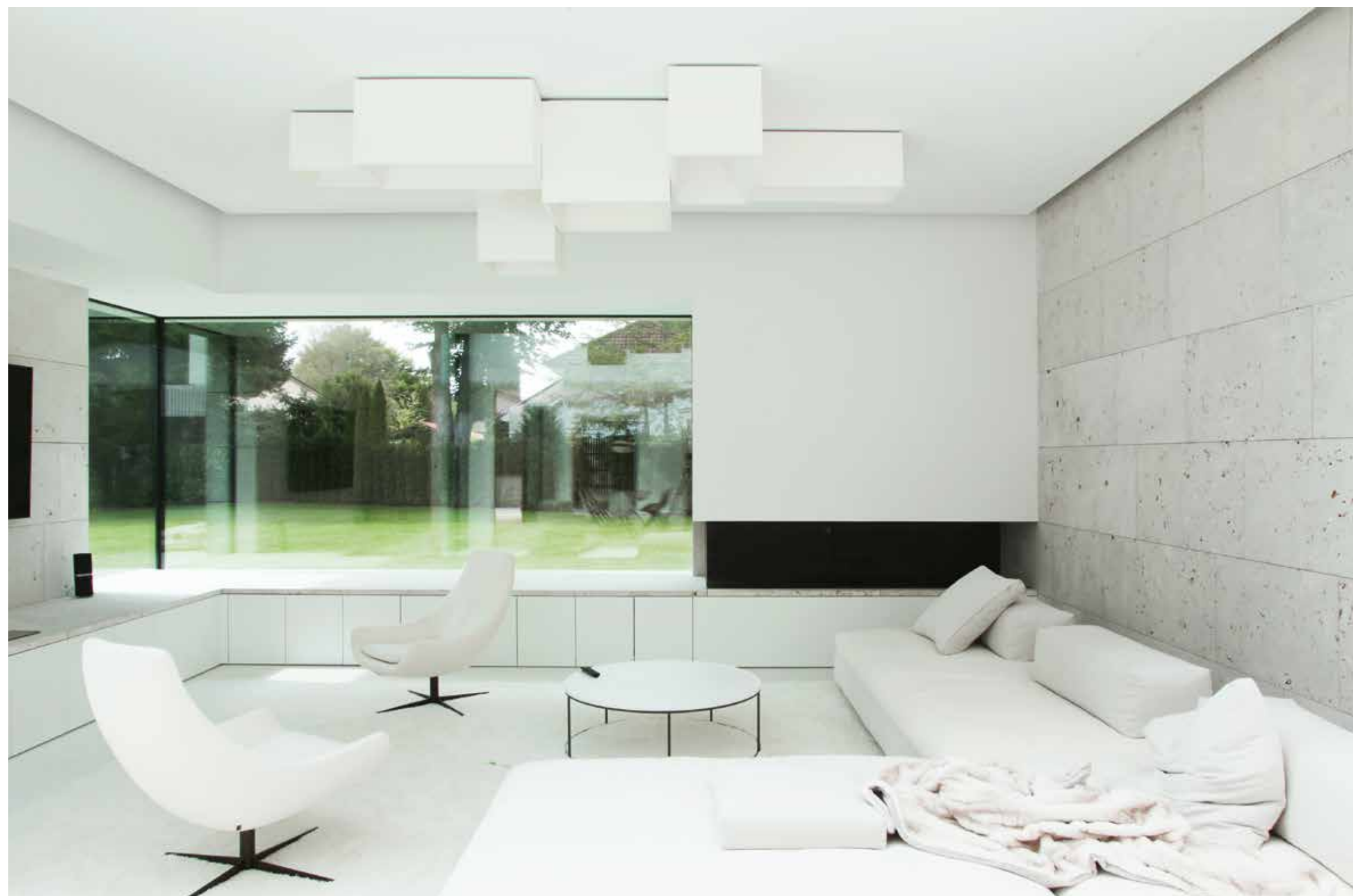
Vardagsrummet med specialbyggda paneler, öppen spis och lagringsmöjligheter. Ett stort hörnfönster vetter ut mot trädgården. Ljusdesignen i taket, Link XXL från Vibia är designad av Ramon Esteve.

nästan omärklig. Det här planet betraktas som ett slags allmänt utrymme – där man kan röra sig fritt – vilket har varit en ledstjärna i designprojektet.