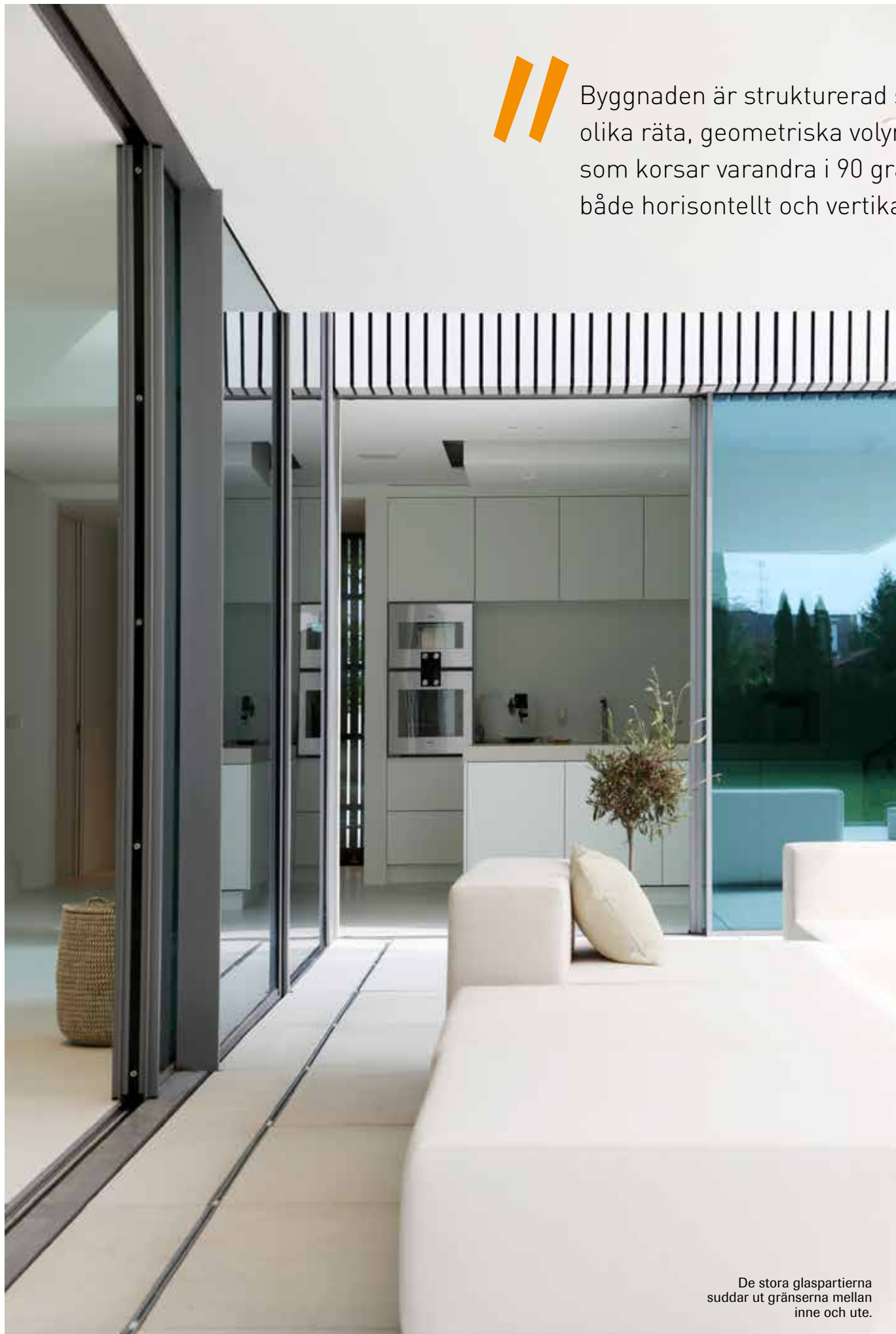
De stora glaspartierna suddar ut gränserna mellan inne och ute.

// Byggnaden är strukturerad som olika räta, geometriska volymer som korsar varandra i 90 grader, både horisontellt och vertikalt.