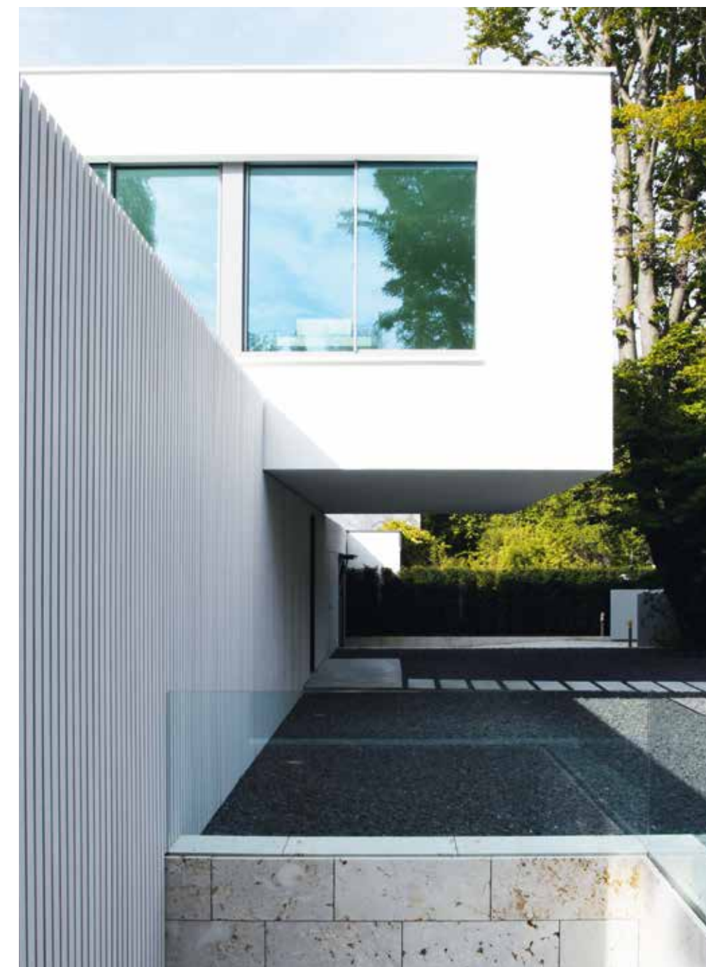
Ingången. Den övre fönsterlösa nivån mot gatan skyddar det privata området mot insyn. Markplanet möjliggör däremot tack vare sin innovativa vertikala fasad-skärm bestående av ett naturfibermaterial med mycket avancerade tekniska egenskaper, som är väder-tåligt och givetvis 100 procent åter-vinningsbart, visuell kommunikation och skapar också en balans åt hela byggnaden och dess enskilda delar. Det ger också byggnadens utseende mot grannskapet.