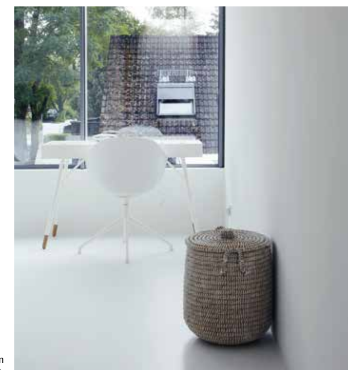
Barnens rum på övervåningen.