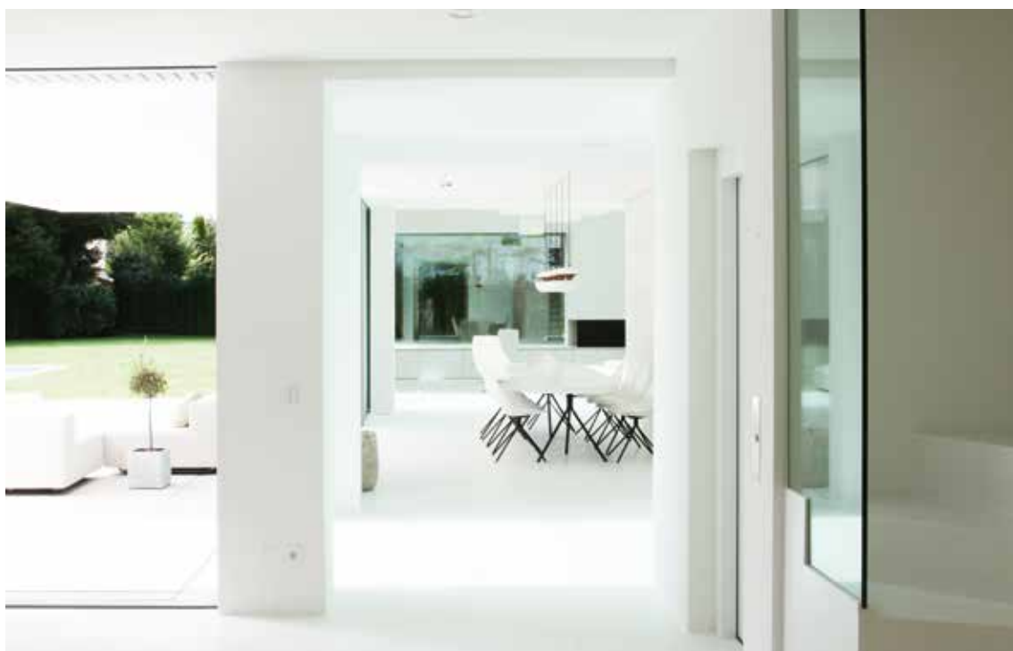
Matsalen är ett öppet utrymme mellan kök och vardagsrum med hela terrassen framför den. På sommaren kan rummet omvandlas till en enda yta, som upplöser gränsen mellan inne och ute.