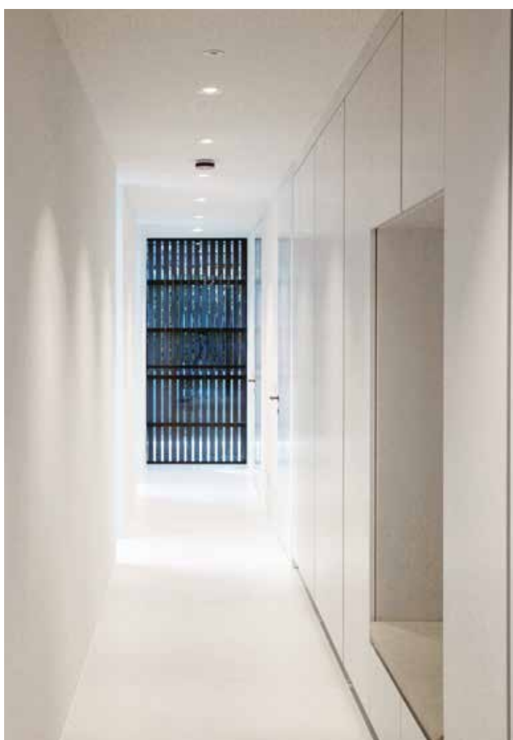
Korridor som leder till en av ingångarna.