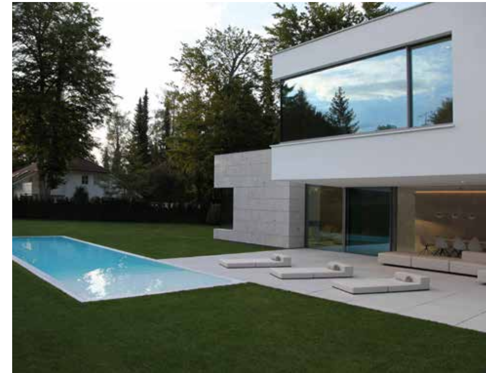
Vy över huset mot trädgården och poolen.

→ En klart enkel och minimalistisk geometri men när den appliceras på rätt sätt framstår som mycket sofistikerad, i klass med mästerverken inom modern arkitektur.