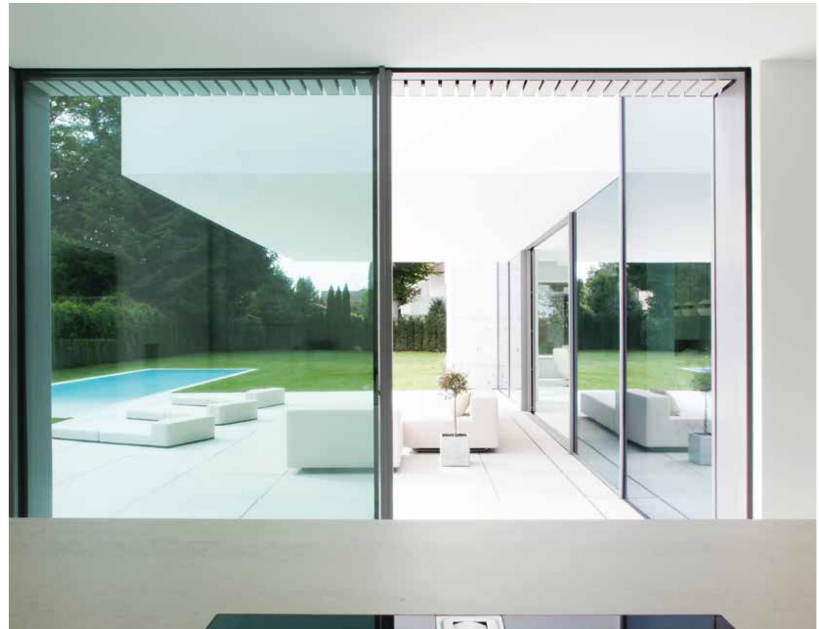
Köket vetter mot terrassen. Stora, takhöga glasöppningar öppnar upp mot terrassen och släpper in dagsljus.