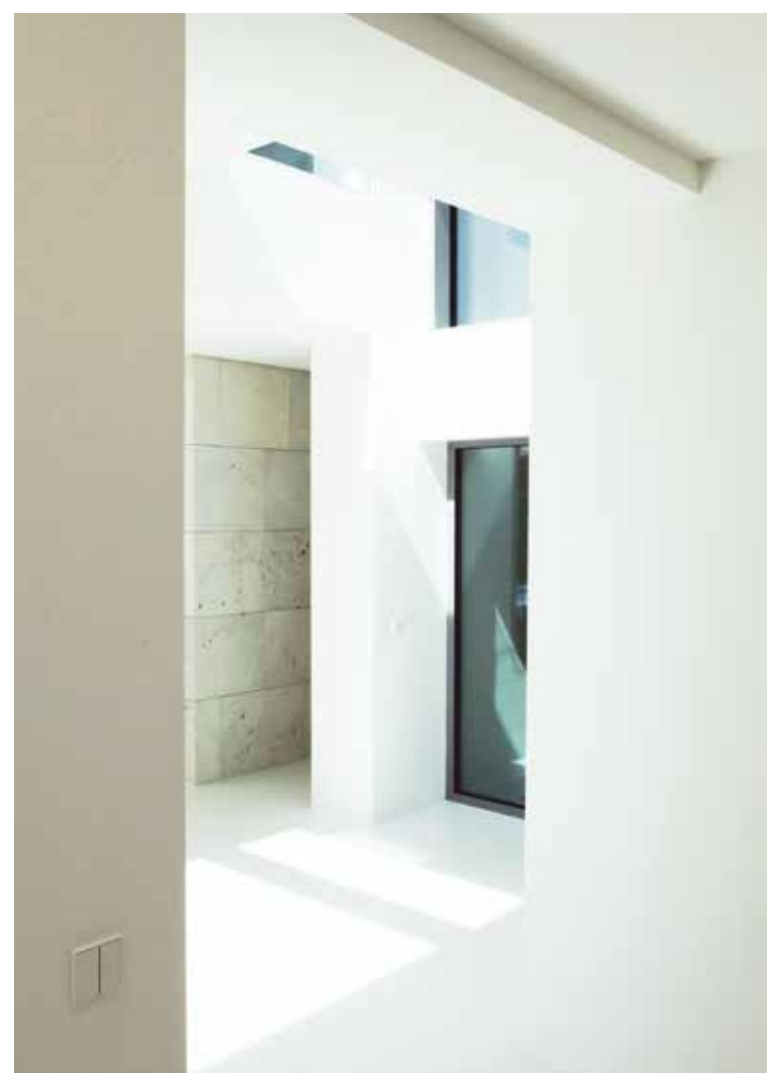
Utrymmet mellan vardagsrummet och huvudtrappan utmärks av ett stort takfönster som släpper in dagsljus.