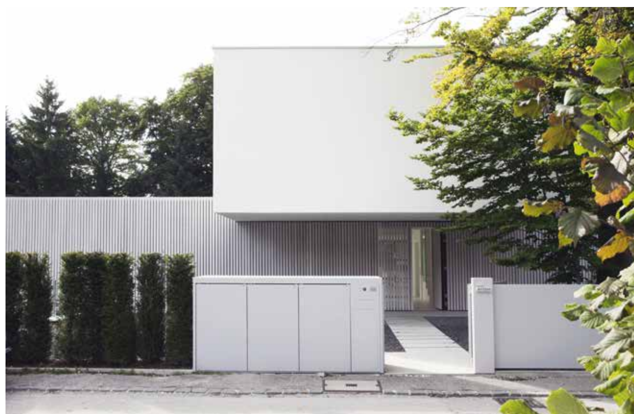
Byggnaden och dess entré är kompatibla med inredningen som framstår som tydlig och explicit för projektet.