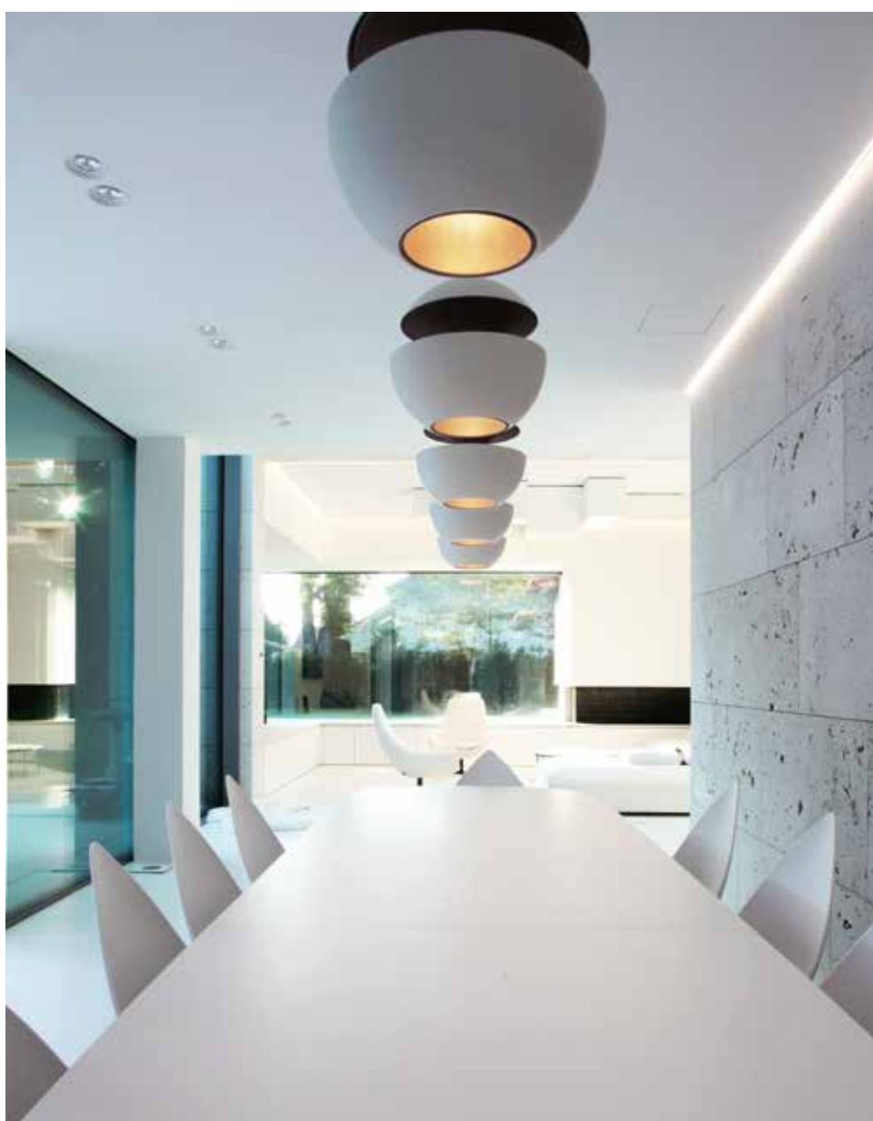
Matbordet med aluminiumlampan, Here comes the sun producerad av DCW med design av Bertrand Balas.

Härifrån är sikten fri utan avbrott längs hela byggnaden, vilket skapar ett mycket starkt samband med de sten-klädda väggarna och de stora glasytorna mot terrassen, som tycks helt integrerad i samma utrymme, vilket gör att gränsen mellan inomhus och utomhus är