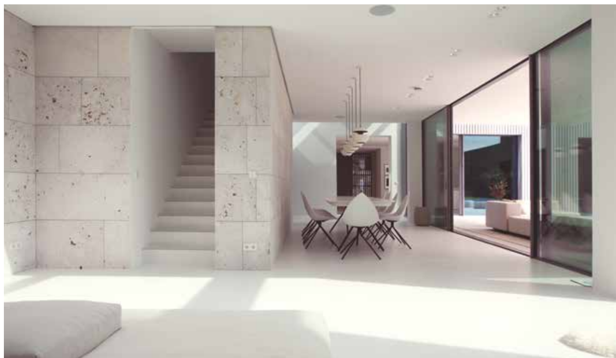
I vardagsrummet var avsikten att hålla rummet så öppet som möjligt utan att tumma på integriteten. Man har därför fört samman utrymmen med olika funktioner utan att blanda ihop dem, vilket skapar fantastiska perspektiv genom hela byggnadens bottenplan.