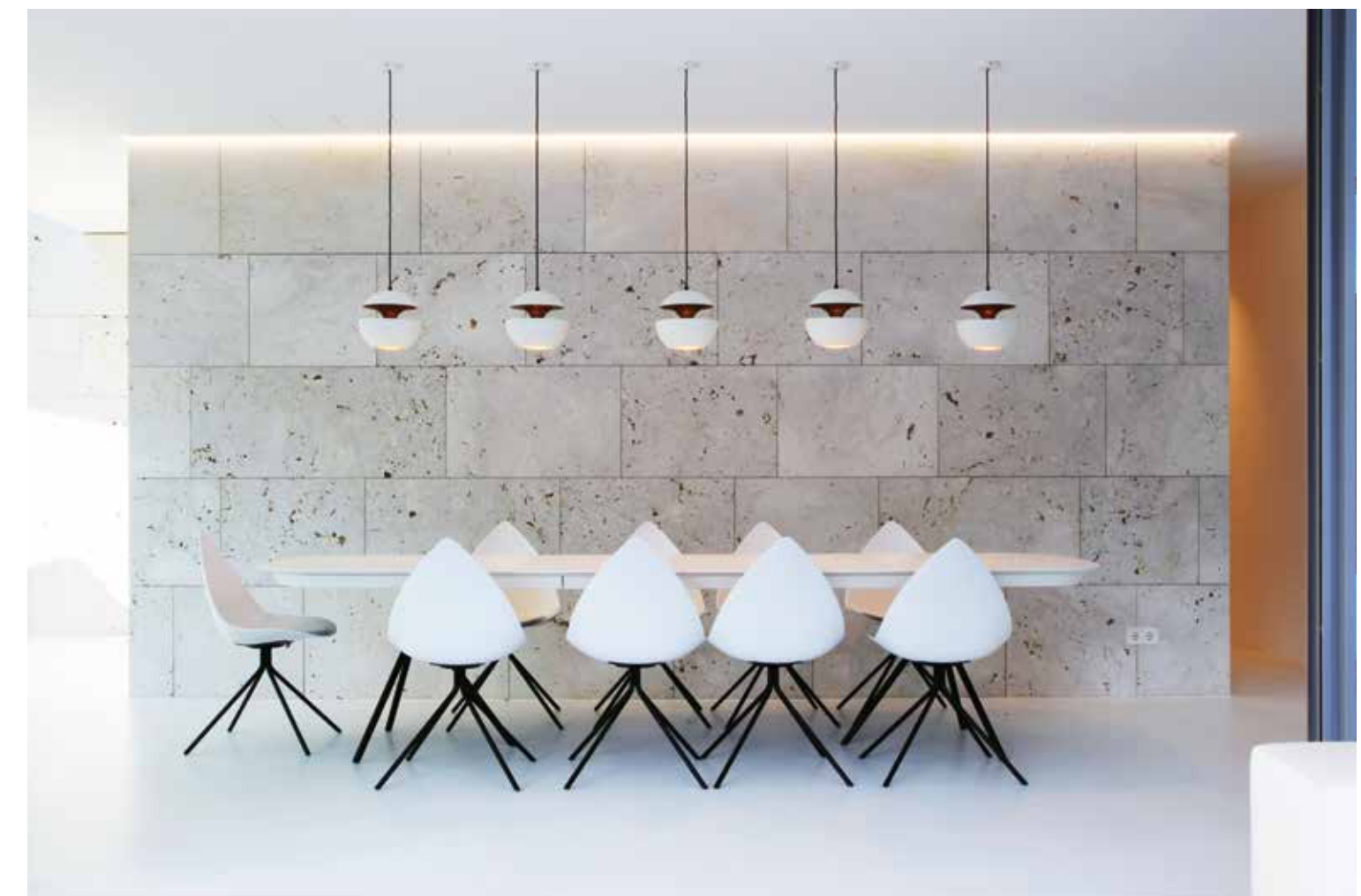
Matsalen med travertinklädda väggar och vitt cementgolv. Ett fåtal möbler och genomtänkt ljusdesign gör att arkitekturen hamnar i fokus.

Den totala ytan är cirka 500 kvadratmeter och uppdelad i tre olika nivåer. I källaren finns garage, teknikrum, ett privat spa och gym med små, tillhörande terrasser som släpper in dagsljus och har direkt tillgång till trädgården. Bottenvåningen följer ett L-format plan med en stor terrass i mitten mot poolen. →