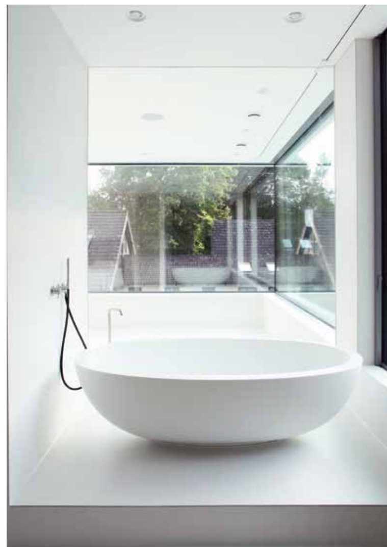
Det stora badrummet på övre våningen med skiljeväggar, förråd och möjlighet till avskärmning med eldrivna gardiner. I harmoni med bottenplanet är golv och väggar ytbehandlade med vit cement. Badkaret Epona från Domovari med infattningarna Milo av CEA