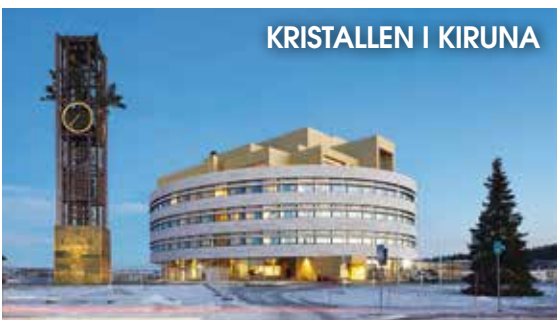
KRISTALLEN I KIRUNA